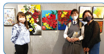
▲ 藝術導師義教孩子