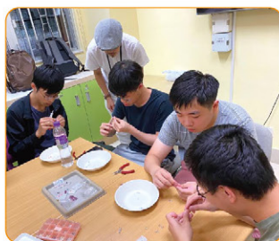
▲ 青年學習「飾物製作」，送贈孩子家屬，別具心意