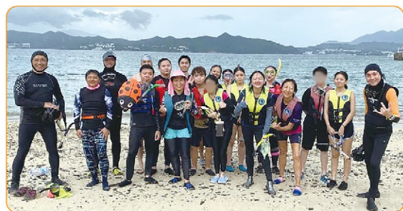
▲ 歷奇挑戰，青年初次浮潛

【青年職向】 家舍青年忙於兼職工作與學業，亦珍惜職前培訓及實習機會。導師協助青年釐清職業志向，提升就業能力及就業率，分別安排他們於私人會所行業參觀，在會所康樂部、接待處及餐飲部實習，亦安排到咖啡店、畫室、製作公司、電腦公司等實習，發掘他們的天賦才能。家舍舉辦禮儀班，為職前作準備。導師更鼓勵他們突破自己，接受新挑戰，不懂游泳也可浮潛，男生做小巧首飾也很精美啊！