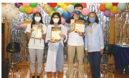
嘉賓頒發孩子各方面進步的獎項和繪畫大賽獎項