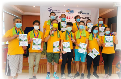
HAESL 獲得「助跑踏前」籌募大獎