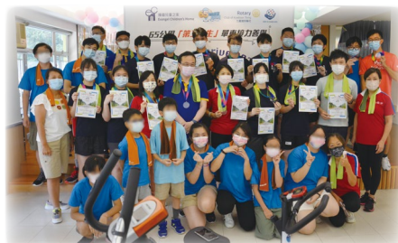
九龍塘扶輪社及朱石麟中學扶青團