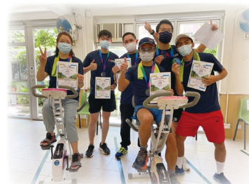
大華銀行 獲得「最佳體育精神大獎」