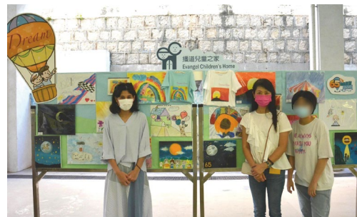
導師培育孩子繪畫創作，親臨打氣

孩子面對過去一年不同的挑戰，卻無損他們學習、進步及成長。一年一度的大總結嘉許禮，在疫情緩和下，在9月25日順利舉行。今年是播道兒童之家65周年，嘉賓光臨到院欣賞孩子的作品與表演之餘，更見證他們各方面的成長。