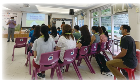
播道會恩福東九堂