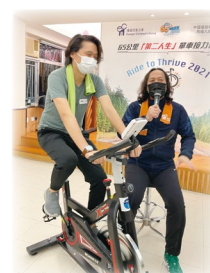
播道會同福九龍東堂