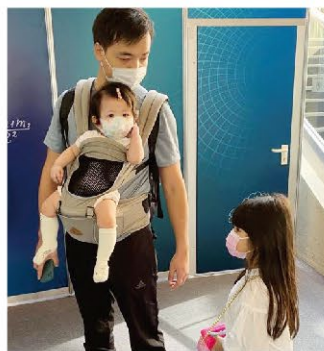
阿渝感謝女兒給他機會學做父親，並珍惜與兩位女兒相處時間