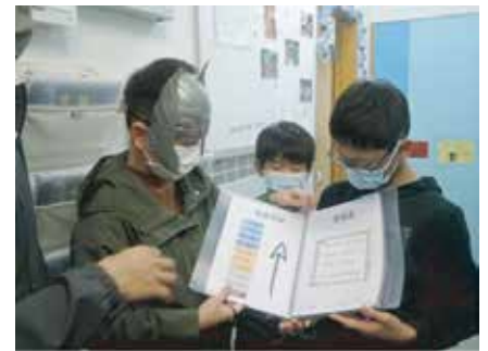
「星章伴我行」計劃 - 小學男生介紹計劃記錄冊