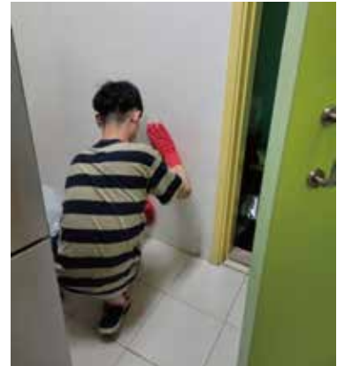
生活訓練 - 料理家務