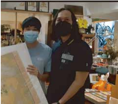
「二手舊物店」行業參觀

感謝愛心業主過去三年同行，支持「青年社區共住服務」，合作開拓院外兩所社區住房。本年度於 2021 年 9 月交還男生屋，女生屋也將於 2022 年 4 月完成交還。離開服務的三名男生自立生活後，也加入「起跑易 R.S.O. 2.0」計劃，接受導師培育，追求信心成長。離開服務的五名女生，於 4 月開始新一段人生旅程。