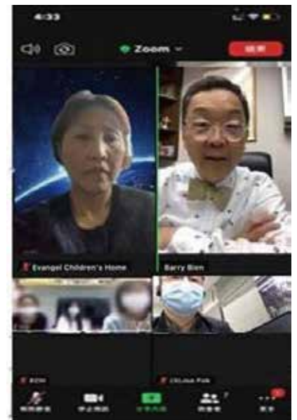
顧問醫生為孩子網上義診