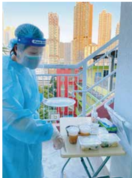
同工全副裝備照顧孩子