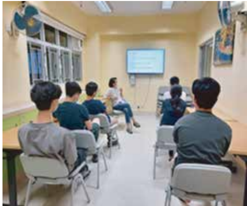
「如何建立情緒智商及如何處理職場人際關係」工作坊