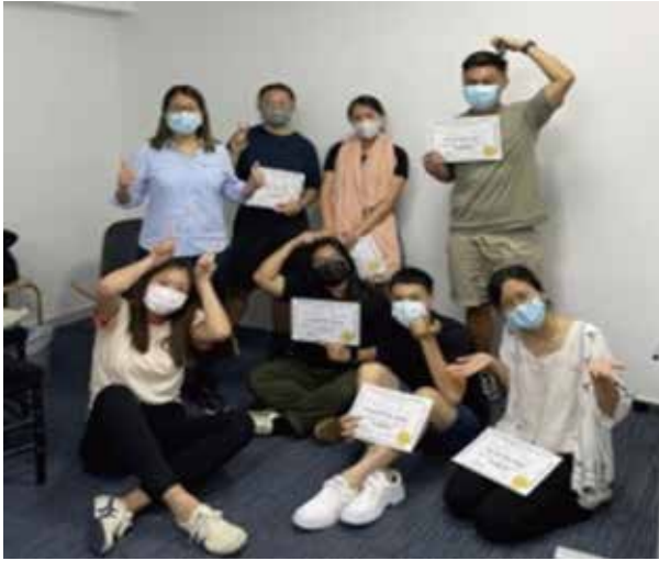
心理繪畫分析培訓

本年度邀請了心理學家為團隊進行培訓。透過三節的繪畫分析工作坊，讓前線同工加深自我了解之餘，知己知彼，更能明白孩子的特性，有效協助他們成長。及後我們更有七名同工，在公餘時間進一步完成國際認可之繪畫分析及催眠師課程，取得有關資歷。