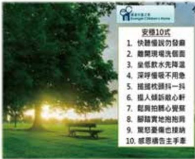
「安穩十式」急口令創作

(2) 2022年3月28日舉行網上「生涯發展及護理講座」，向本院青少年介紹投身護理行業相關資訊。