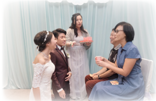
焯賢(左一)視翟姐夫婦(右)為父母，結婚時堅持向他們敬茶