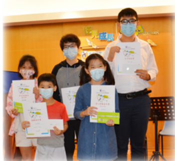
孩子喜獲嘉許，努力得到肯定！