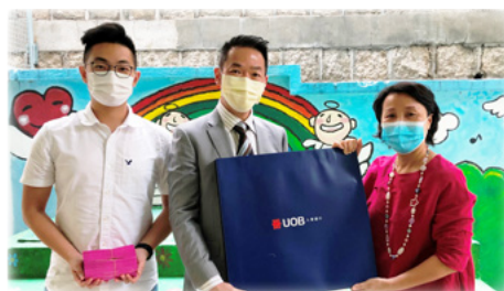
大華銀行代表送來月餅