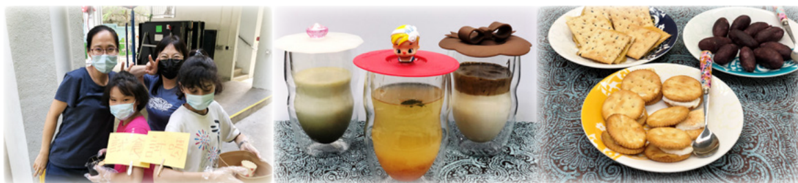
棉花糖夾餅、美味小紫薯、400轉咖啡，很受同工歡迎，仲可以試食！

受疫情影響未能安排外出活動，孩子們發揮創意及關愛精神，與家舍家長製作各式美食特飲，為同工加油；創作慰問咭關心醫護。期後孩子可參加Ukulele暑期班；關心妍妍亮生命音樂小教室歌唱班；與義工一起繪畫體驗，創作獨一無二的雨傘，疫見成長。