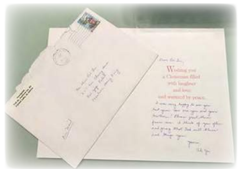
錦華有幸收到亞姨親筆寫給他的咭