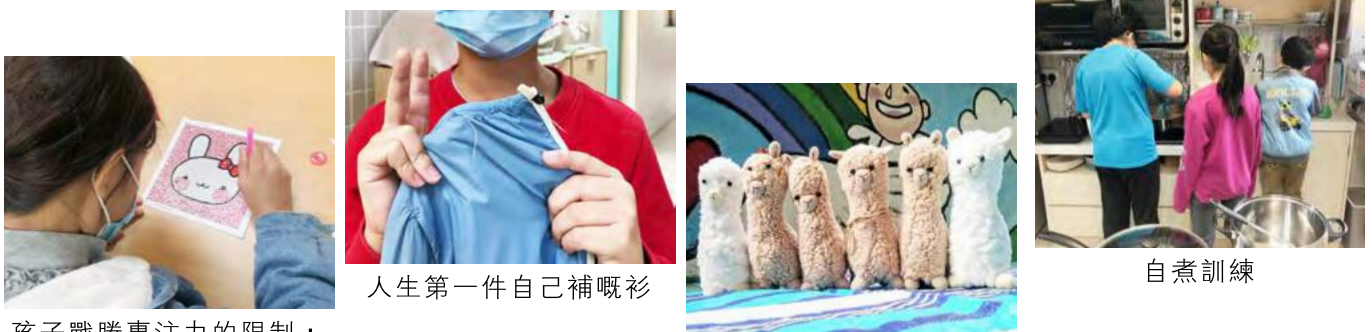
孩子戰勝專注力的限制，將閃石逐粒貼上。

兒童日間院護服務「S.E.N.學齡支援計劃」沒有像一般託管或補習班而停止服務，堅持為基層在職家庭服務，爸媽可安心上班。非在職家庭的孩子亦能「停課不停學」。有特殊學習需要的孩子在導師指導下溫習、學煮食、使用針線、做手工等，穩步成長。