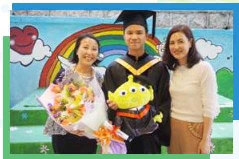
澤桂曾獲玉清慈善基金資助補習