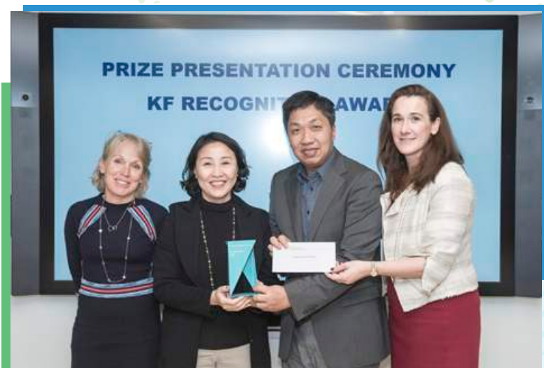
青年家舍服務獲凱瑟克基金 頒發最佳服務項目獎