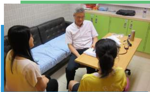
孩子獲轉介接受治療