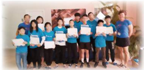
Splash Foundation 游泳班

衷心感謝企業伙伴及義工，對孩子的愛護，為他們舉辦及贊助有益身心活動，幫助孩子發掘專長，提升自信，擴闊孩子視野。