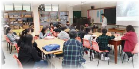
JLT - 生活書院體驗 學習惜食和感恩