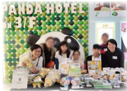
悅來酒店 - 義賣日及聖誕自助餐