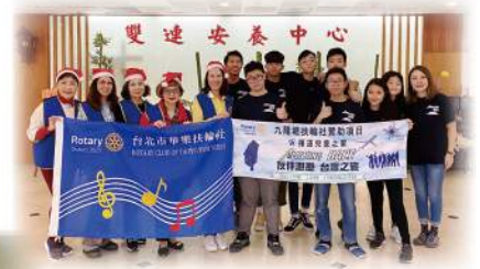
結連台北市樂華扶輪社 社友一起服務