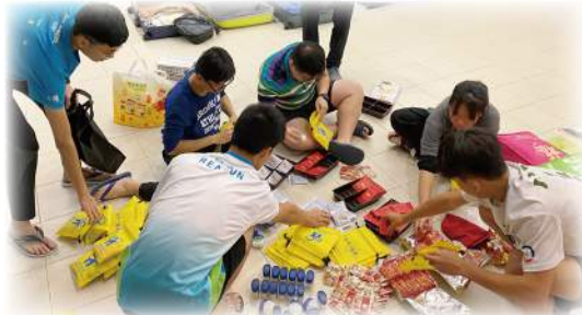
大家認真執拾活動及探訪物資