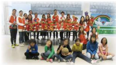
信和集團 - 聖誕探訪及派禮物

衷心感謝企業伙伴及義工，對孩子的愛護，為他們舉辦及贊助有益身心活動，幫助孩子發掘專長，提升自信，擴闊孩子視野。