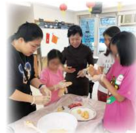
易施童樂230 - 湯圓/揮春DIY