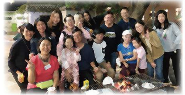
離院舍友聖誕BBQ，大家庭開枝散葉