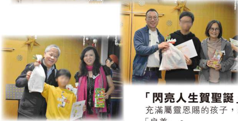
「閃亮人生賀聖誕」晚會 ，長期支持者伴孩子追夢，嘉許充滿屬靈恩賜的孩子，表揚他們「節制」、「忍耐」、「信實」、「良善」。