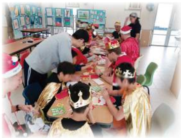
Capco - 聖誕服飾工作坊