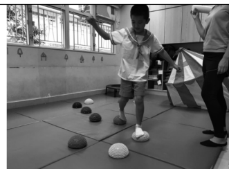
SEN學齡支援 - 早期介入服務 - 感統訓練