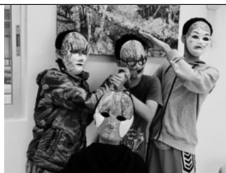
輔導服務計劃 - 藝術治療改善負面情緒