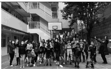
抗疫Fun Time - 家舍比賽