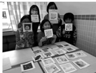
「抗疫一齊行」- 為醫護打氣