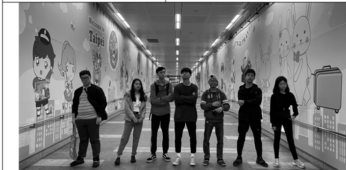
家舍少年外地考察 - 「友伴遊歷 台灣之旅」