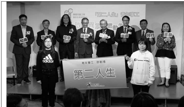
第二人生青年事工啓動禮