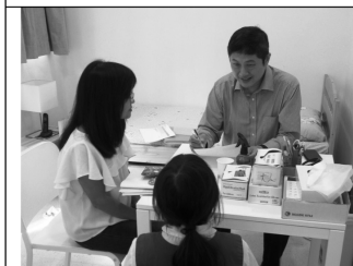
2Rs計劃 - 孩子獲跨專業介入治療