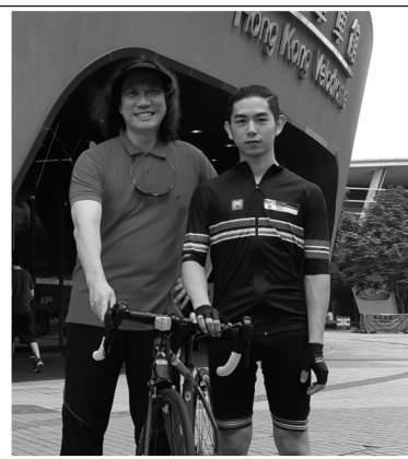
燃動家舍青年生命