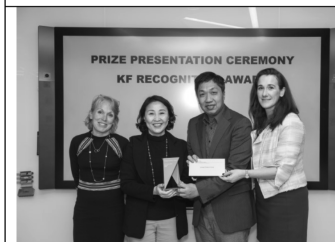
青年家舍服務獲凱瑟克基金頒發最佳服目項目獎