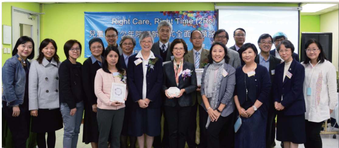
2Rs計劃 (Right Time, Right Care Project) 成效發佈會