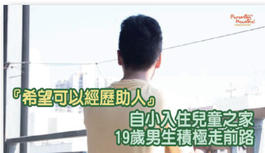
無家青年個案分享