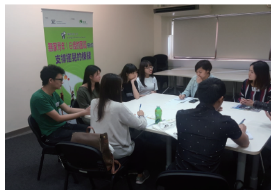
青年宿舍宿生向傳媒講述獨自面對生活的苦困