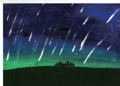
“A Warm North Pole with Hope” 少年組亞軍

MYBK文化藝術教育發展協會舉辦了「燦爛孩子盃國際青少年及兒童繪畫大賽2018」，林浠兒以“A Warm North Pole with Hope”奪得自由創作 - 少年組亞軍，曾綽希的「蟲蟲太陽花」獲兒童A組 - 金獎，其他參賽孩子均獲優良獎，孩子表現得到外界認同。大會更把部份報名費撥捐作助養用途。