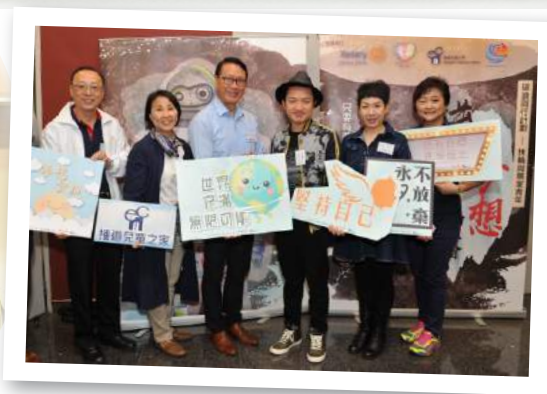
國際扶輪3450地區與嘉賓王祖藍，齊心為無家青年打氣