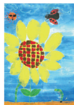
「蟲蟲太陽花」 兒童A組 - 金獎