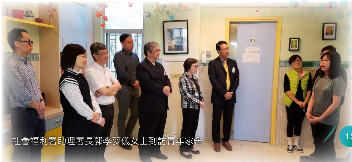
社會福利署助理署長郭李夢儀女士到訪青年家舍

深信「第二人生助跑計劃」，樹立關注無家青年的生命工程，回應未來院舍服務，更多18歲離院青年的過渡需要，締造機遇，凝聚不同支持者，一起關愛這群具潛質的青年，突破逆境童年的成長缺口，逆流而上。