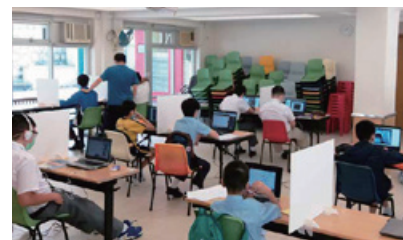
穿上校服在家舍網上復課