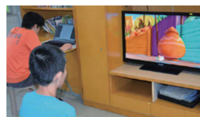
家舍設施得到改善