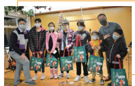
多位孩子於設計比賽獲優異獎