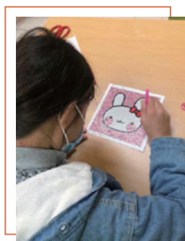
閃石畫訓練專注力