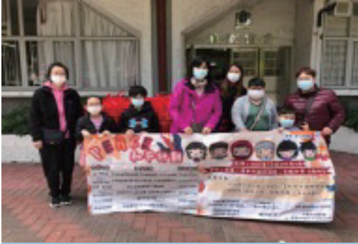
黃大仙 PEACE 和平計劃