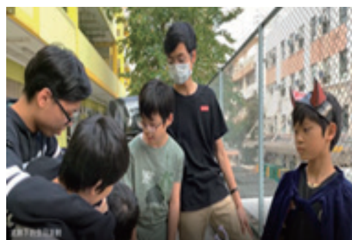
疫境自強小劇場劇照