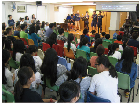
播道兒童之家2016/2017大總結頒獎禮 -嘉許孩子過去一年的進步