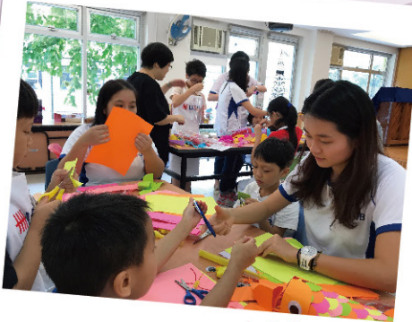
大華銀行 -傳統花燈創作