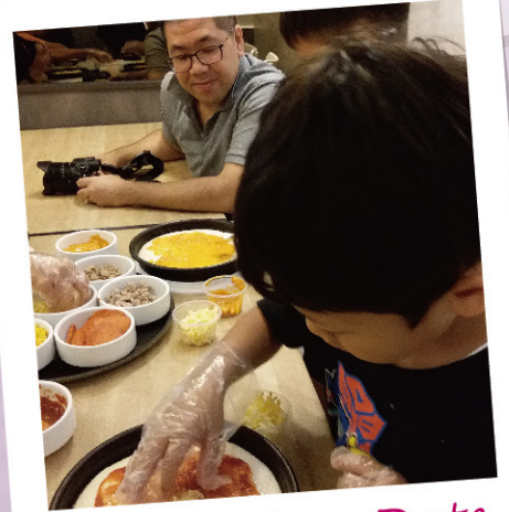
Dimension Date -薄餅製作