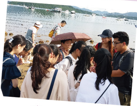
半島酒店 - 生態遊

整年的學習，孩子最期待假期的來臨，可以參與各項活動。但今年天氣變化莫測，雨季未到已不斷下著滂沱大雨、颱風的威力所造成的影響亦相當之大；差不多一個月沒有見到太陽；又試過在出活動前，一天內三次掛黃色暴雨，但到活動當天，天氣便穩定下來，足夠讓孩子開開心心、平平安安的玩樂一天。天父很愛孩子，總會在適當的時候，天氣便會漸漸好起來，讓孩子與陽光盡情玩遊戲。