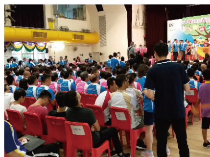
少年警訊 -滅罪夏令會