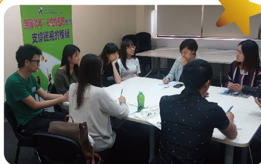
青年宿舍宿生向傳媒講述獨自面對生活的苦困。