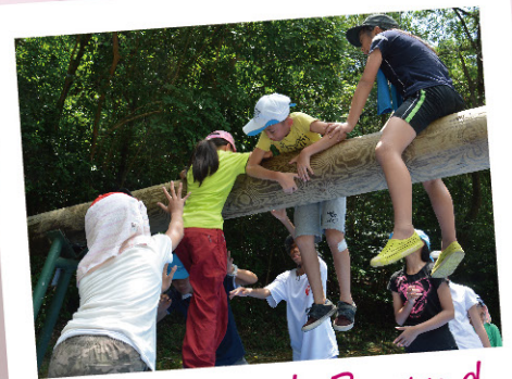
Outward Bound -發揮合作精神