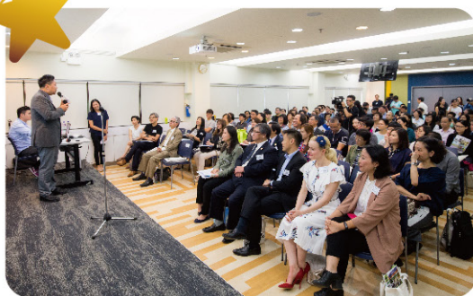
各界人士踴躍出席