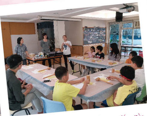
寶光集團-皮革工作坊