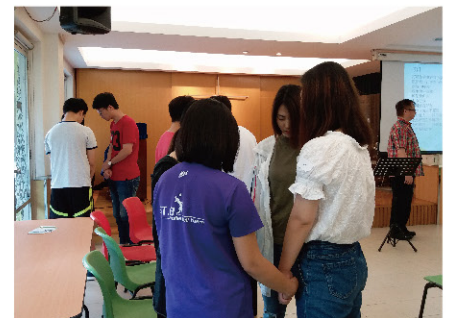
杭州崇一堂探訪交流