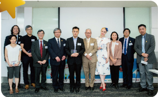
嘉賓講者、兒童之家董事、同工、助跑大使大合照

當日出席人數越150人，其中有七成來自院護業界，另有企業機構、教會、個別支持者，大家對青年人的需要和面對的焦慮，同樣關注。研討會獲得大家好評，對無家青年需要多了一份了解，深信這群青年是青春、有魄力，只要扶助他們一把成為社會棟樑，開展他們的「第二人生」。