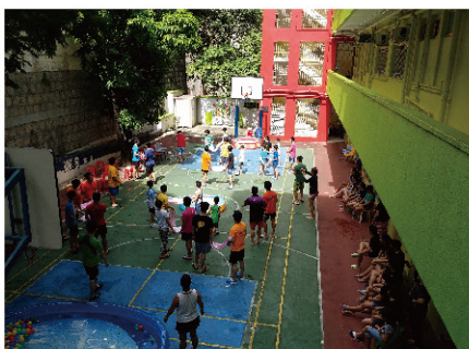
兒童之家 -「夏水禮」啟動