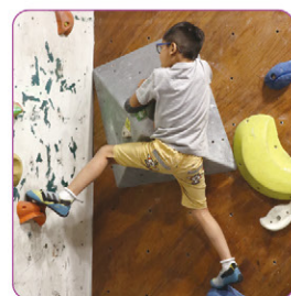
▲小學男生勇敢踏出去，嘗試攀石訓練