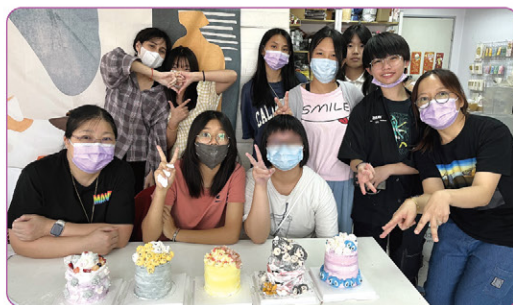
▲卡通造型棉花糖蛋糕製作