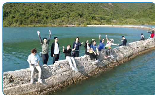
▲導師與青年院友到上窰及曝罟灣堤圍

早前更舉辦「生命導師嘉許禮」，邀請生命導師及青年分享同行點滴，內容包括職涯實習、方向探索及互信關係。