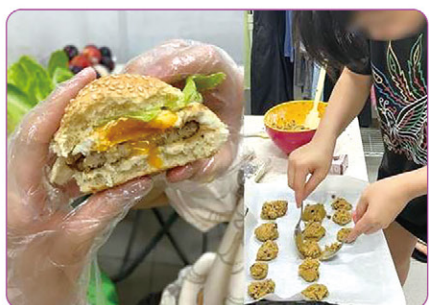
▲漢堡包及曲奇製作