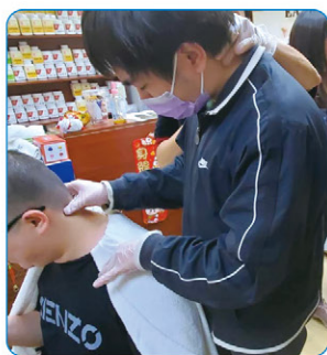
▲職展工作坊到訪中醫藥中心體驗