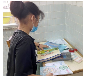
學業以外，阿芝的個人自理也進步不少