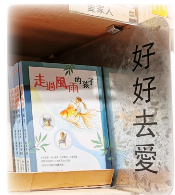
獲香港出版學會： 「心理勵志類出版獎」